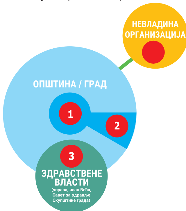
Слика. 3. Опције за локацију секретаријата здравог града

Систем. Поставите секретаријат здравог града тамо где може да повећа утицај на систем градске управе. Идите кроз хијерархију и доприте до многих сектора. Прегледајте организационе структуре и административне системе. Утврдите где је најбоље деловати. Обавестите свог главног политичара о опцијама. Постоје четири основна организациона модела (слика 3).