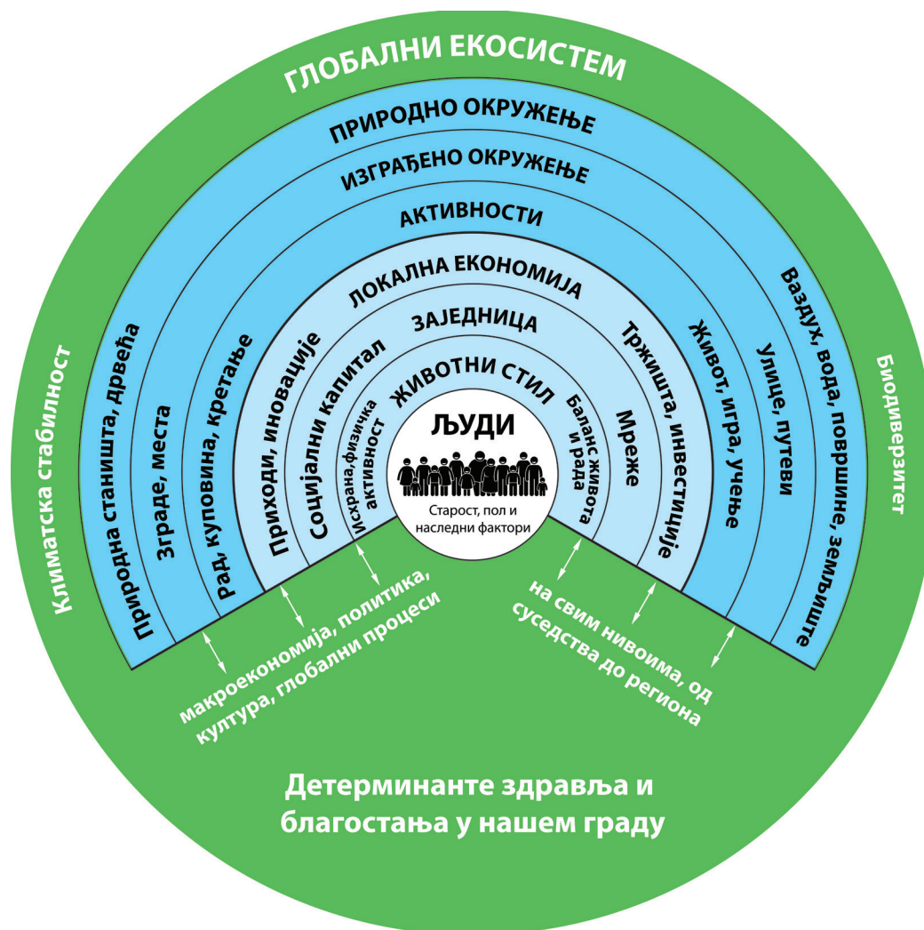
Слика 4. Одреднице здравља и благостања у урбаним срединама

Целина. Прегледајте ширу слику града након сваке фазе развоја. Мапа насеља показује град као сложен систем, који захтева здравље у свим политикама многих нивоа власти и интервенције многих сектора. Прегледајте Приручник СЗО „Здравље у свим политикама“ ако је потребно. Упознајте се са свим полазним елементима за развој здравља, на сваком нивоу и у сваком сектору система. Оцените перформансе различитих процеса, структура, планова и програма у оквиру интегрисаног системског приступа здравом граду. У идеалном свету, креатори политике и доносиоци одлука раде заједно у хармонији да би постигли овај циљ (Слика 4).