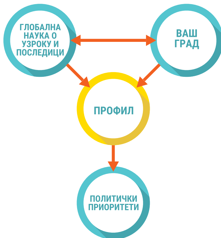
Слика 2. Наука, ваш град и његов профил