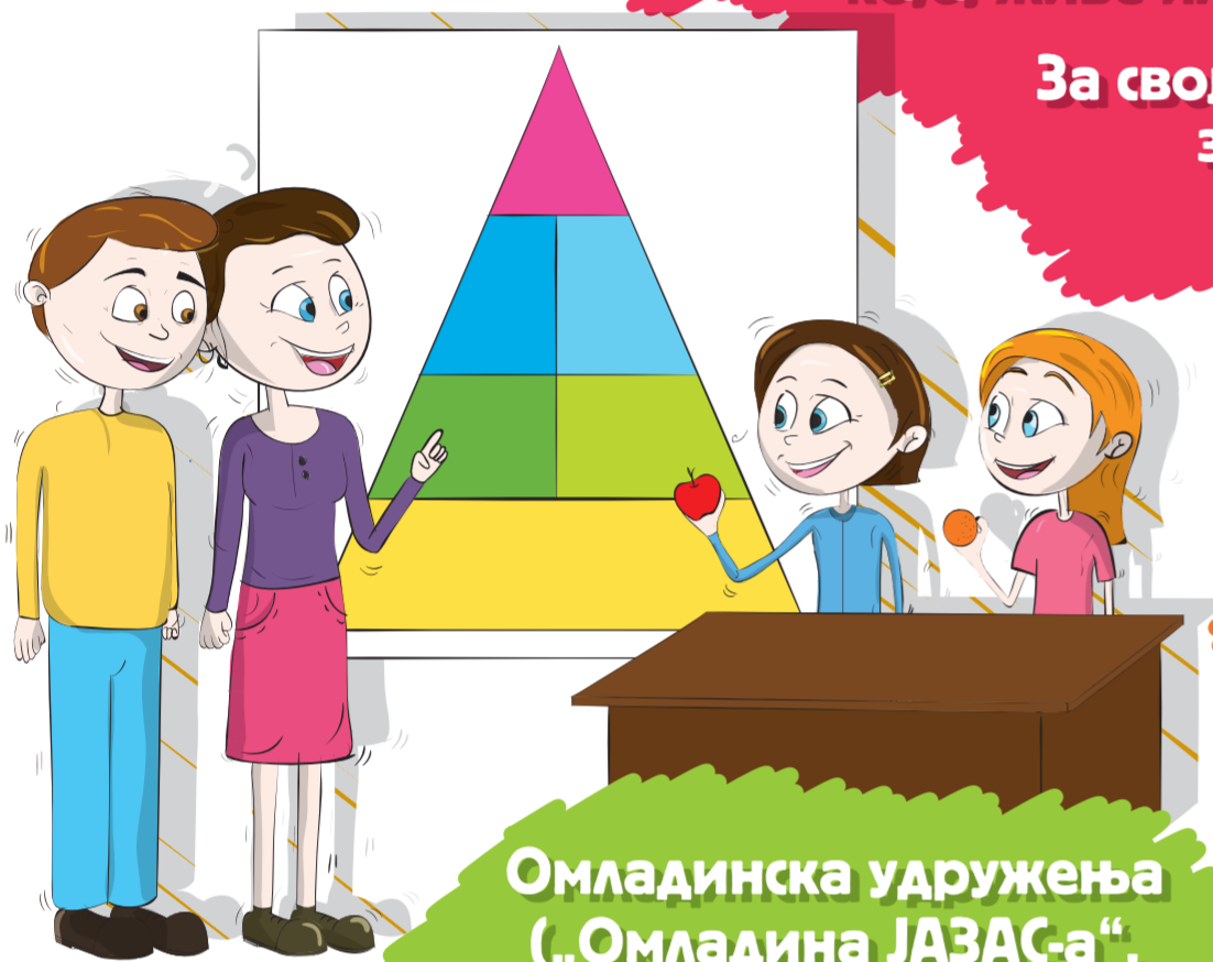
Омладинска удружења („Омладина ЈАЗАС-а“, „Омладински клуб“ ...)

За свој рад они не примају никакву награду, осим задовољства што се осећају корисним. То се још зове - волонтирање.