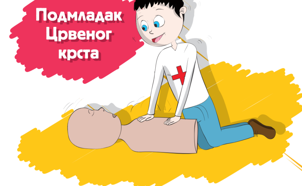
Подмладак Црвеног крста

Свако удружење је усмерено на неку своју сврху или циљ.