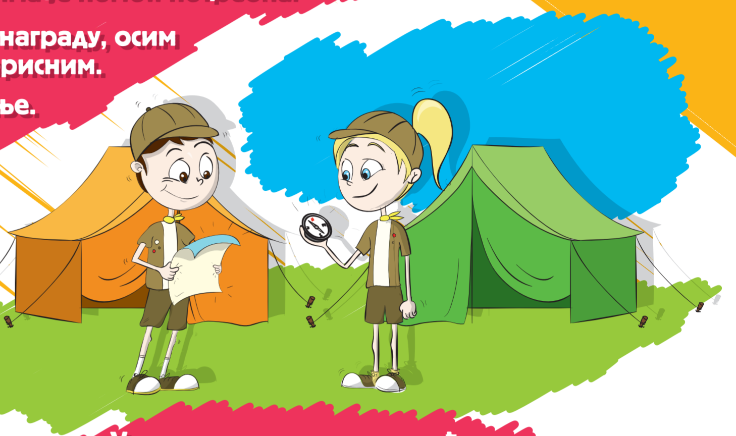
Удружење горана и извиђача

ОВО СУ НАЈЧЕШЋА УДРУЖЕЊА ЗА ДЕЦУ И МЛАДЕ: