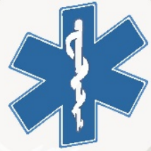
Знак хитне медицинске помоћи.

ХИТНА МЕДИЦИНСКА ПОМОЋ (ХМП) је посебна служба за збрињавање и пружање стручне помоћи ТЕШКО ОБОЛЕЛИМ И ПОВРЕЂЕНИМ ЉУДИМА на месту где им је позлило или се догодила несрећа и током транспорта, до пријема у болницу. ХМП ради цео дан и целу ноћ. Позивни број телефона је 194!